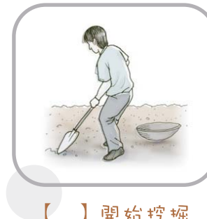
【 】 開始挖掘