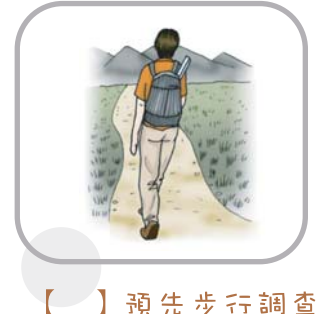
【 】 預先步行調查

2. 根據下面物件出現的時代早晚，你覺得他們各自應該在那一層被考古學家發現呢？請把圖案和相對應的文化層連起來。 (田野工作)