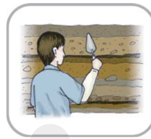
【 】 細部整理、修界牆

1. 下面是考古工作的內容，你知道考古學家從事這些工作的順序嗎？將代表順序的數字填入括號中。 (田野工作)