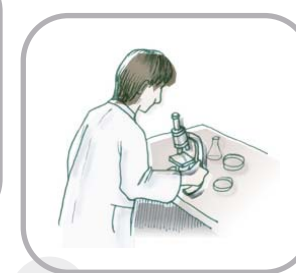
【 】 實驗室研究