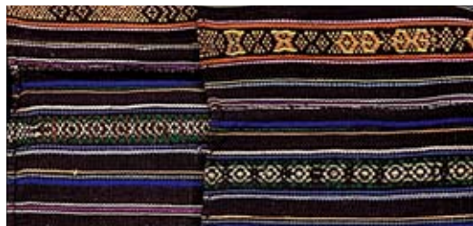
泰雅族北勢群新娘服局部和北勢群常服局部