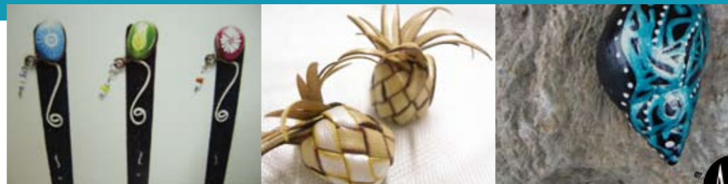
馬雄秋 黃美花 撒根恩

本月由協會邀請三位藝術創作者，教大家如何做出兼具文化內涵與時尚流行的獨特用品喔！