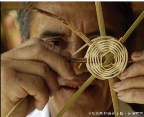
太魯閣族的編籃工藝，花蓮秀林