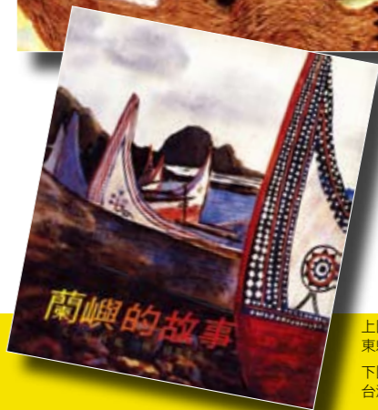
下圖/《蘭嶼的故事》台灣書店。