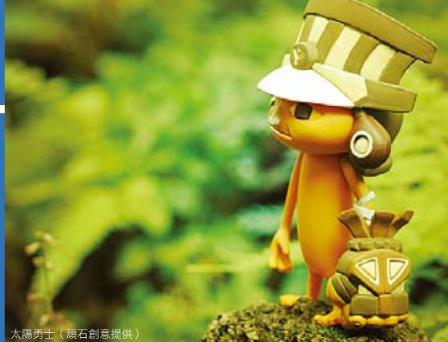
太陽勇士

簡介：活化典藏資源的產業觀點、博物館的老文化與新流行、博物館典藏與數位藝術、博物館兒童產品、文化資源與設計元素。