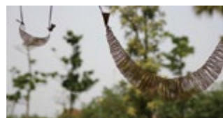
圖 / 宜蘭縣立蘭陽博物館

近年宜蘭發現早期先住民的重要金飾，本館與宜蘭縣文化局合作，讓民眾以金鯉魚為主要題材並發揮創意製作鯉魚吊飾。