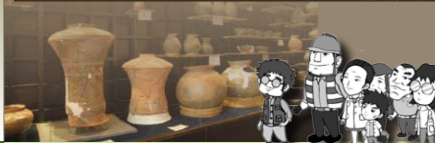
大湖文化鳥山頭 期犬牙狀墜飾