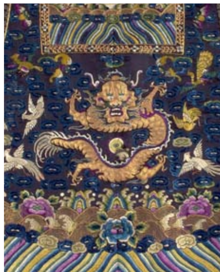
侗族女子背心(中國貴州省黎平縣德鳳鎮)——國立臺灣史前文化博物館館藏

龍是十二生肖中唯一不存在於現實生活中的動物，但它的形象卻又全都取自現實世界中。此外，「古老的東方不只一條龍」，包括日本、印度、中國西南少數民族……等都有豐富的龍文化；西方世界亦然，然而東西方世界的龍文化卻有大大的不同。到底龍為何會出現？龍的原型如何開始？「龍」係假ㄟ嗎？讓本特展深入淺出地帶你一探究竟。