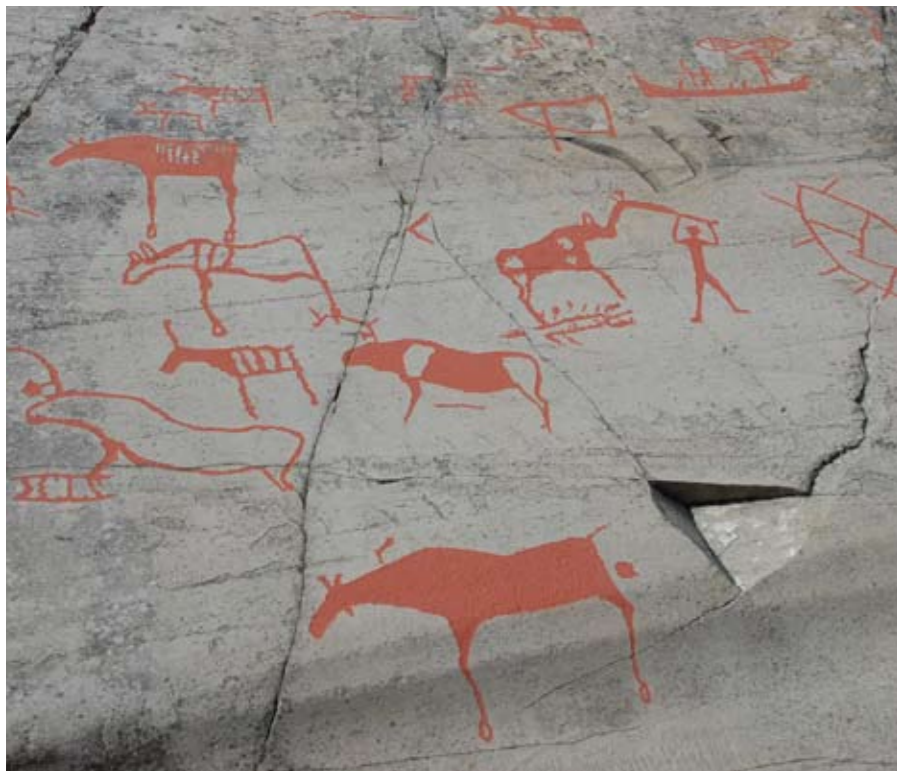
挪威 阿爾塔岩畫 (Rock Art of Alta)

原始藝術的史前岩畫傳遞出沒有文字時期的人類文化樣貌，在世界各地都有發現。1978年起，臺灣「萬山岩雕群」的現蹤並開始透過學術研究，而重現於世人眼前，2008年8月22日行政院文化建設委員會公告指定為臺灣第七處國定遺址。本特展以萬山岩雕群為核心，揭開其神秘面紗一角，期望能開啟未來臺灣岩雕探索的新頁，並廣度面的與世界岩畫點接軌，更清楚的呈現遠古史前人類在岩石畫布上所留下的這部史前史書的記錄。