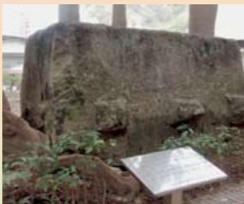
出土自臺東縣成功鎮白守蓮遺址的岩棺

此件岩棺出土自臺東縣成功鎮白守蓮遺址，1956年宋文薰教授進行調查時稱之為「Taknipai岩棺1」，1986年白守蓮遺址上開闢產業道路，岩棺遂被遷移至臺東縣文化