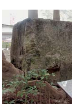
目前岩棺置放於臺東縣文化中心前